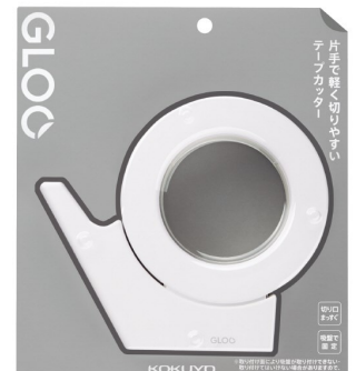
T-GM500NW (大巻) ¥1,760 T-GM510W (小巻) ¥1,078