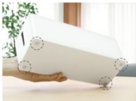
底面には滑り止め付き