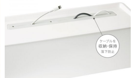
ケーブルを収納・保持 落下防止