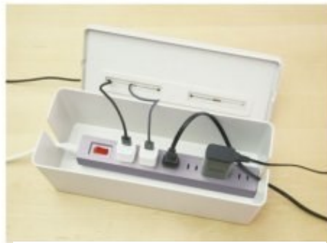
ボックス内にテーブルタップやケーブル類などを収納