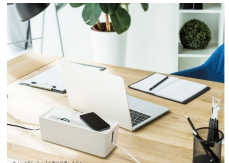
心地いい暮らしの新アイデア シンプルなケーブルボックス