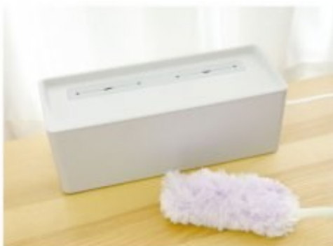
ケーブルにほこりが絡まず掃除しやすい